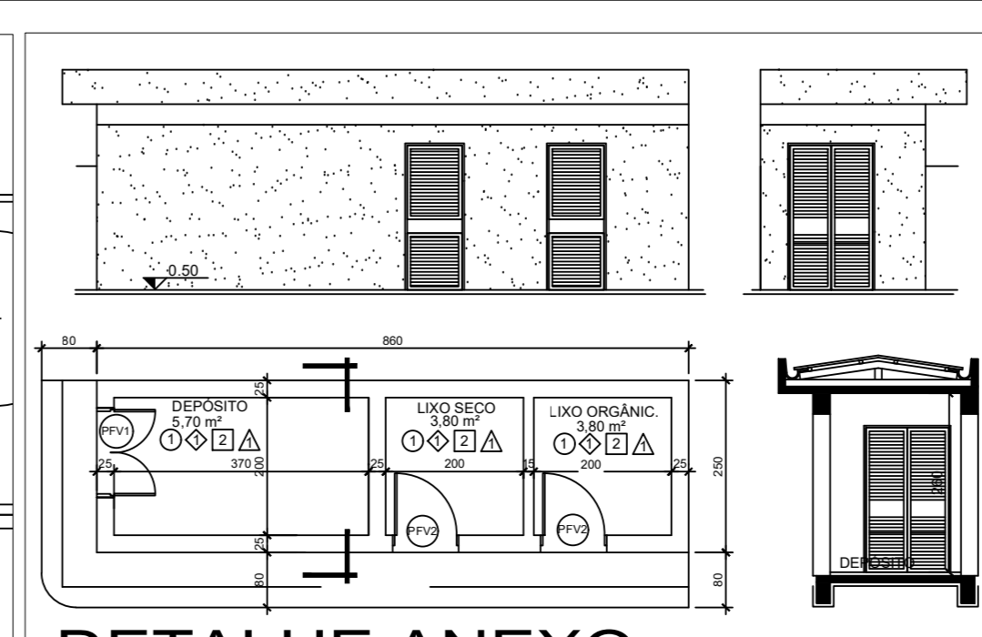
DETALHE ANEXO ESCALA: 1/100