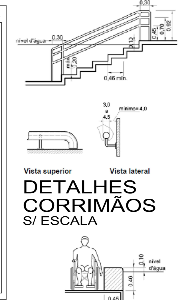
DETALHES CORRIMÕES S/ ESCALA ESCALA: 1/100