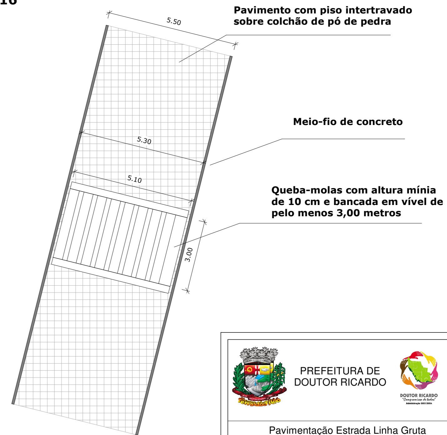
Detalhamento do quebra-molas Escala: 1/100