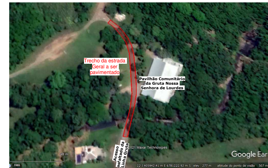
Situação/Localização Escala: 1/200

Comprimento total das vigas: 38, 50 m Armação das vigas com Barras 5/16"